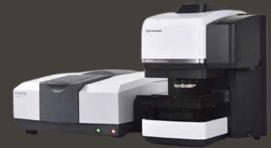
AUTOMATED INFRARED MICROSCOPE (FTIR) SHIMADZU - AIM-8800