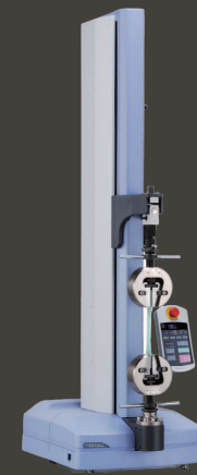
ÇEKME-BASMA TESTİ SHIMADZU, EZ-LX