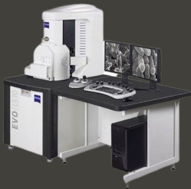
TARAMALI ELEKTRON MİKROSKOBU (SEM) ZEISS, EVO MA 10