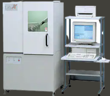
X-RAY POWDER DIFFRACTION (XRD) SHIMADZU, XRD 6100