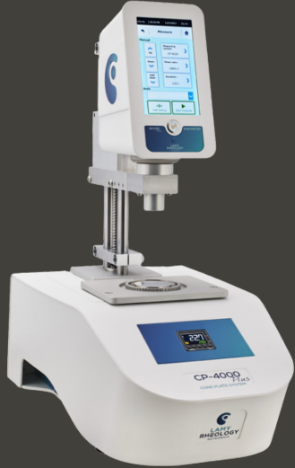
REOMETRE - VİSKOZİMETRE Lamy Rheology Instruments - RM200 Plus